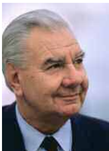
René Monory, le fondateur du Futuroscope

En juin 1987, René Monory fondait le premier parc d'attractions en France. Alors président du Conseil général de la Vienne, ce visionnaire, armé d'une force de conviction hors du commun, imagine un concept : un site tourné vers le futur sur lequel coexisteraient une aire de loisirs, une zone d'activité économique et une aire de formation, pour relancer la jeunesse et l'esprit d'entreprise d'un département endormi. 24 ans après, le pari est réussi et le modèle de développement du territoire que représente le Futuroscope fait référence à travers le monde.